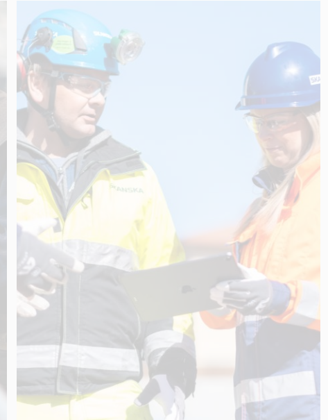
Teknologi, innovasjon og grønn forretnings-utvikling