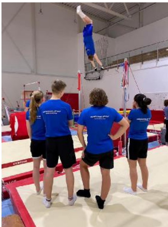
Bilde 1: Økt i turnhallen med Talentskolen

Med støtte fra Samfunnsløftet har vi i 2022 fullført første kull av Talentskolen, og startet opp med et nytt kull. Det første kullet bestod av utøvere fra svømming, etc. Utøverne var samlet annenhver tirsdag til treningsøkter og fagkvelder, og kullet ble avsluttet med en turnøkt og sosial kveld i april. Ikke lenge etter startet arbeidet med å rekruttere deltakere til nytt kull med oppstart i august, der vi tok med oss læring fra det første kullet inn i et nytt år med nye talenter. Årets kull består nå av 12 utøvere fra randonee, svømming, kunstløp, volleyball, skiskyting og klatring. Modellen med treningsøkter og fagkvelder annenhver tirsdag har vi holdt fast ved, der de gjennom høsten har vært innom temaene «smarte mål/målprosess», «veien til toppidrett» og «helse og ernæring», samt fått en innføring i fagområdene motorikk og ferdighetsutvikling og kraft/styrke.