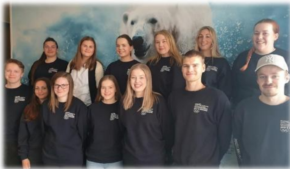
Nettverket for unge ledere her samlet under tinget til TFIK i Hammerfest