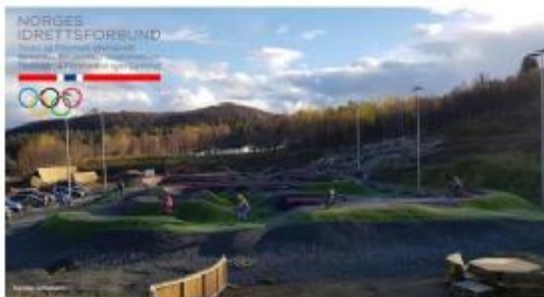
Troms og Finnmark idrettskrets

Mål: Idretten vil at det skal bygges anlegg slik at all ønsket aktivitet kan gjennomføres