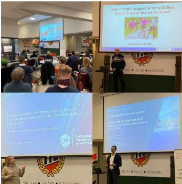
Bilde 2: Utholdenhetsseminar i samarbeid med UiT Idrettshøgskolen