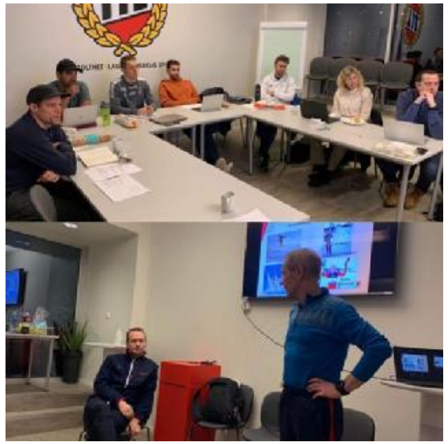
Bilde 2: Topptrenerforum i Troms