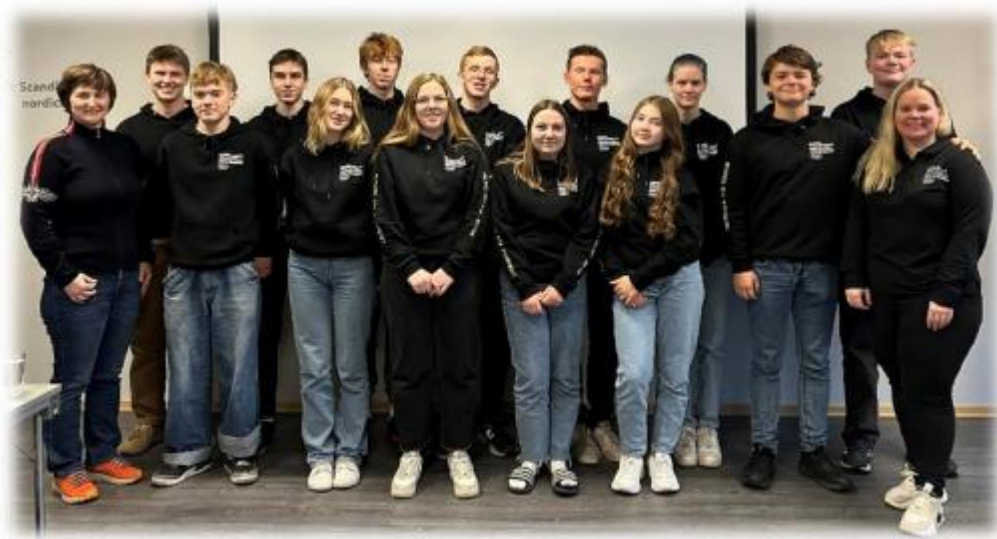
Lederkurs for ungdom gjengen under del 2 i Harstad

Mål: Idretten vil tilby idrettsaktivitet av god kvalitet basert på våre verdier