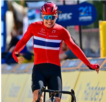
Verdensmester sykling U19