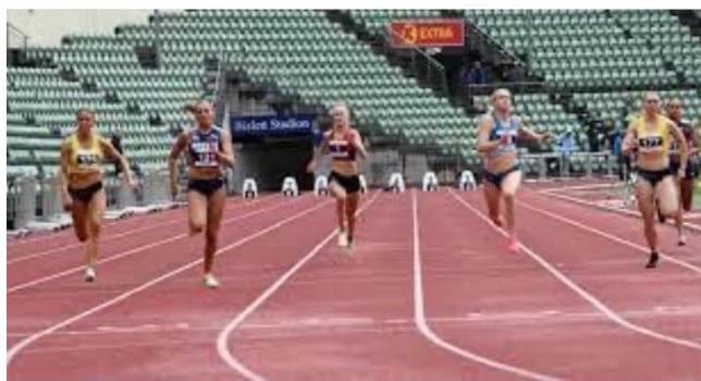
Nordisk mester i friidrett