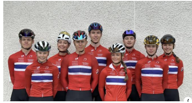
EM i landevei – TMT laget