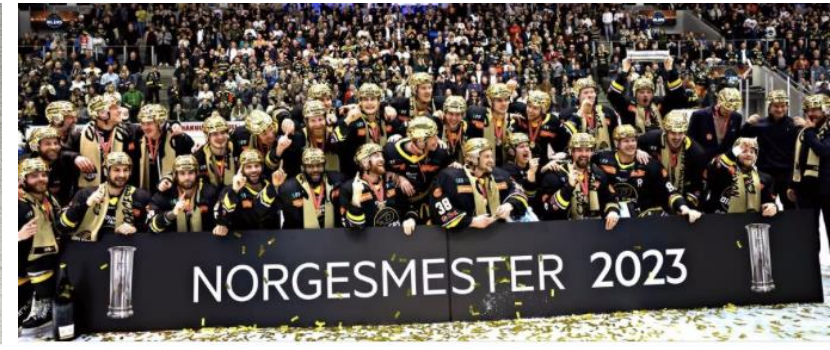
6 elever fra TID og TMT – norsk mester i ishockey