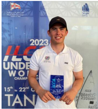
VM i seling