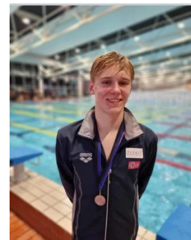
1. pl Nordisk svømming