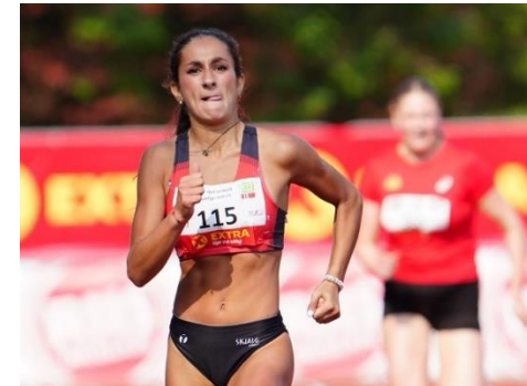
Deltakelse i VM i Peru