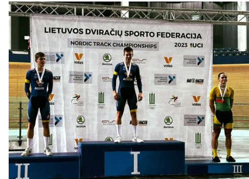
1. og 2. pl Nordisk sykling