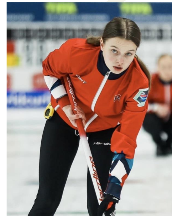
Faksimile Haugesunds Avis 04/03/23