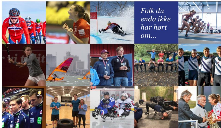
IDRETT OG STUDIER - Du kan sjelden leve av å heve medaljer. Men det går fint an å leve av å heve lønn!