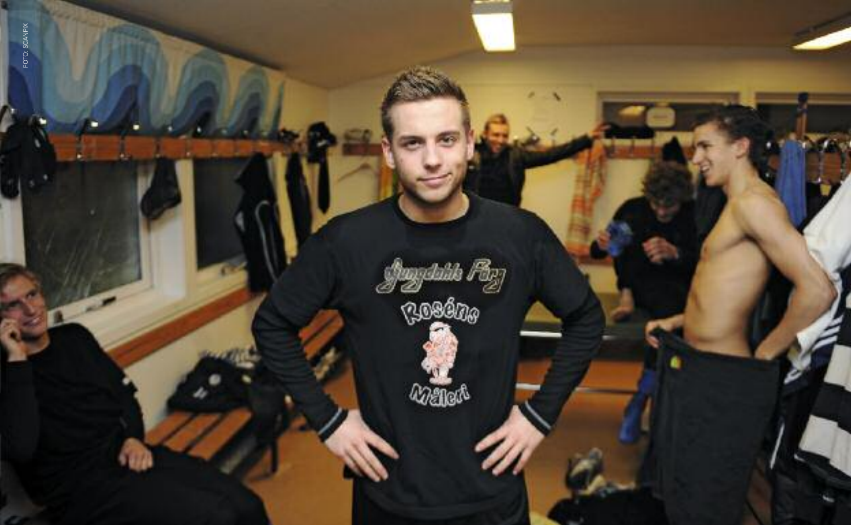
Anton Hysén (20) er den første åpne, homofile, mannlige spilleren i svensk fotball.