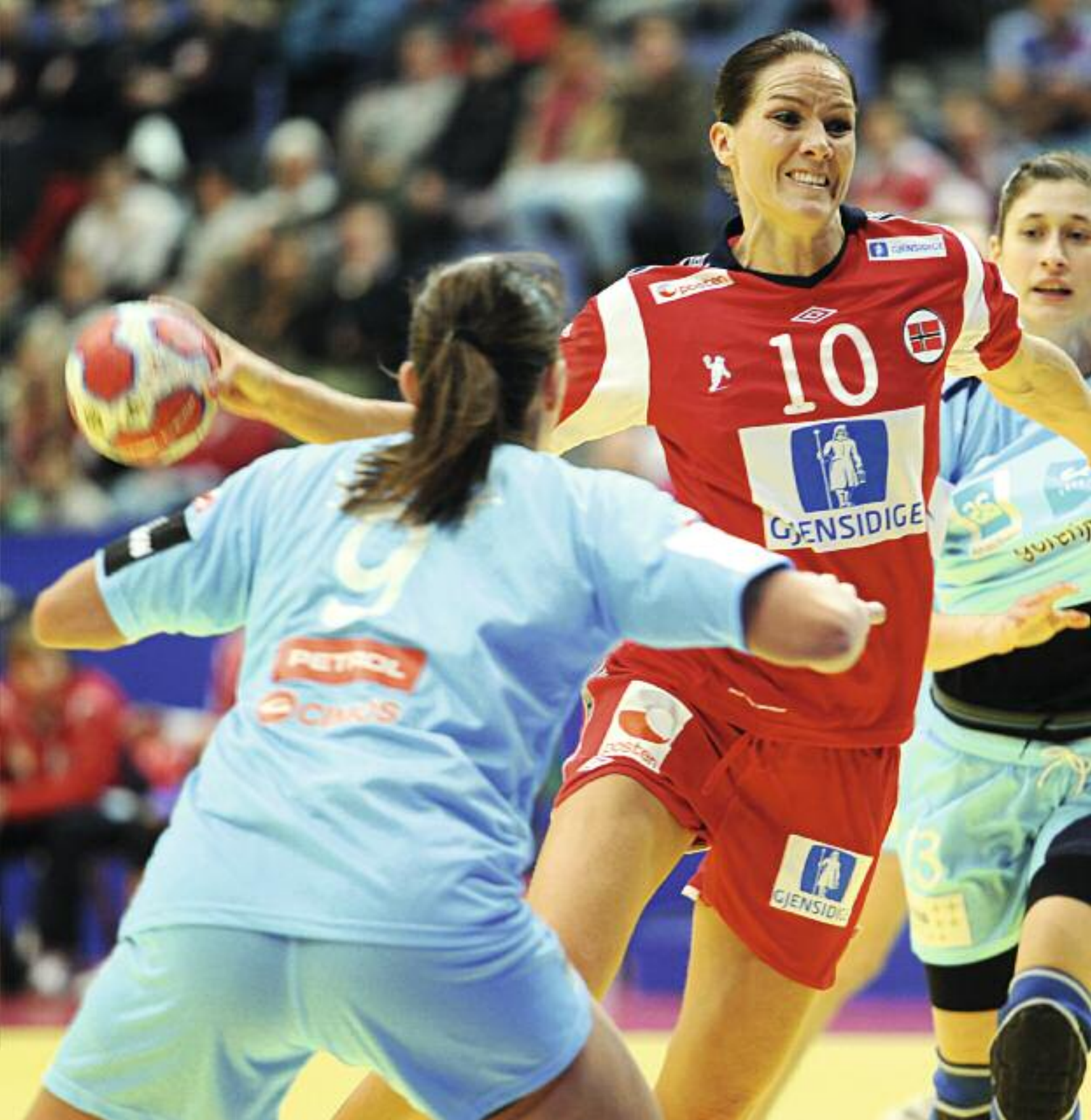
Gro Hammerseng i aksjon mot Slovenia under håndball-EM i 2010.