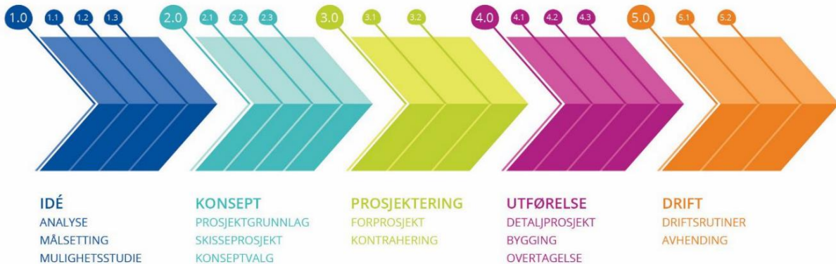
Figur 1 Prosjektveilederen