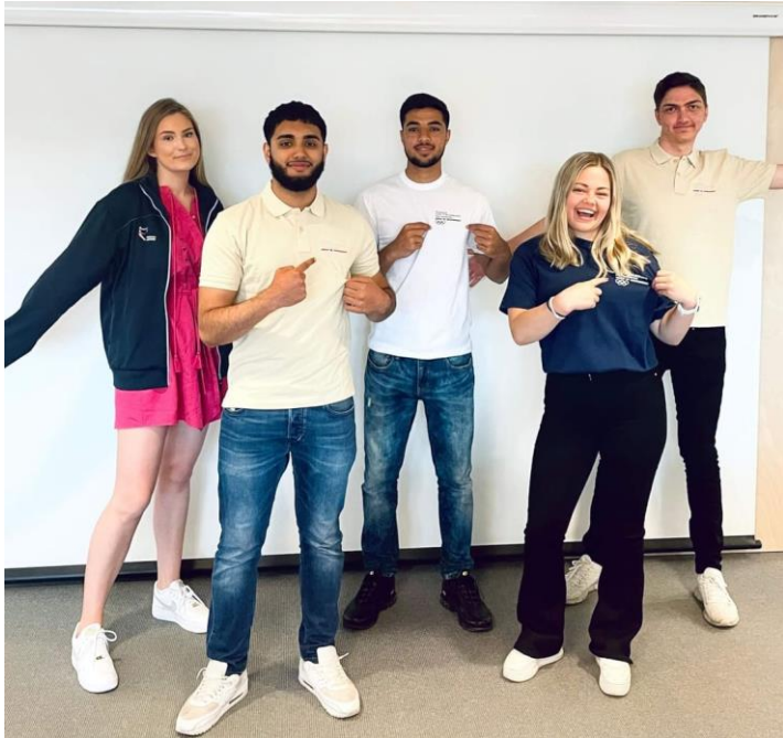
OIK Sommerteam, 2021