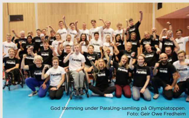
God stemning under ParaUng-samling på Olympiatoppen.

- Det overordnede målet er å doble antall medaljekandidater i paralympiske leker i løpet av en åtte års periode. Prosjektene arbeidsmål skal derfor være å utvikle flere unge parautøvere til høyeste internasjonale nivå.