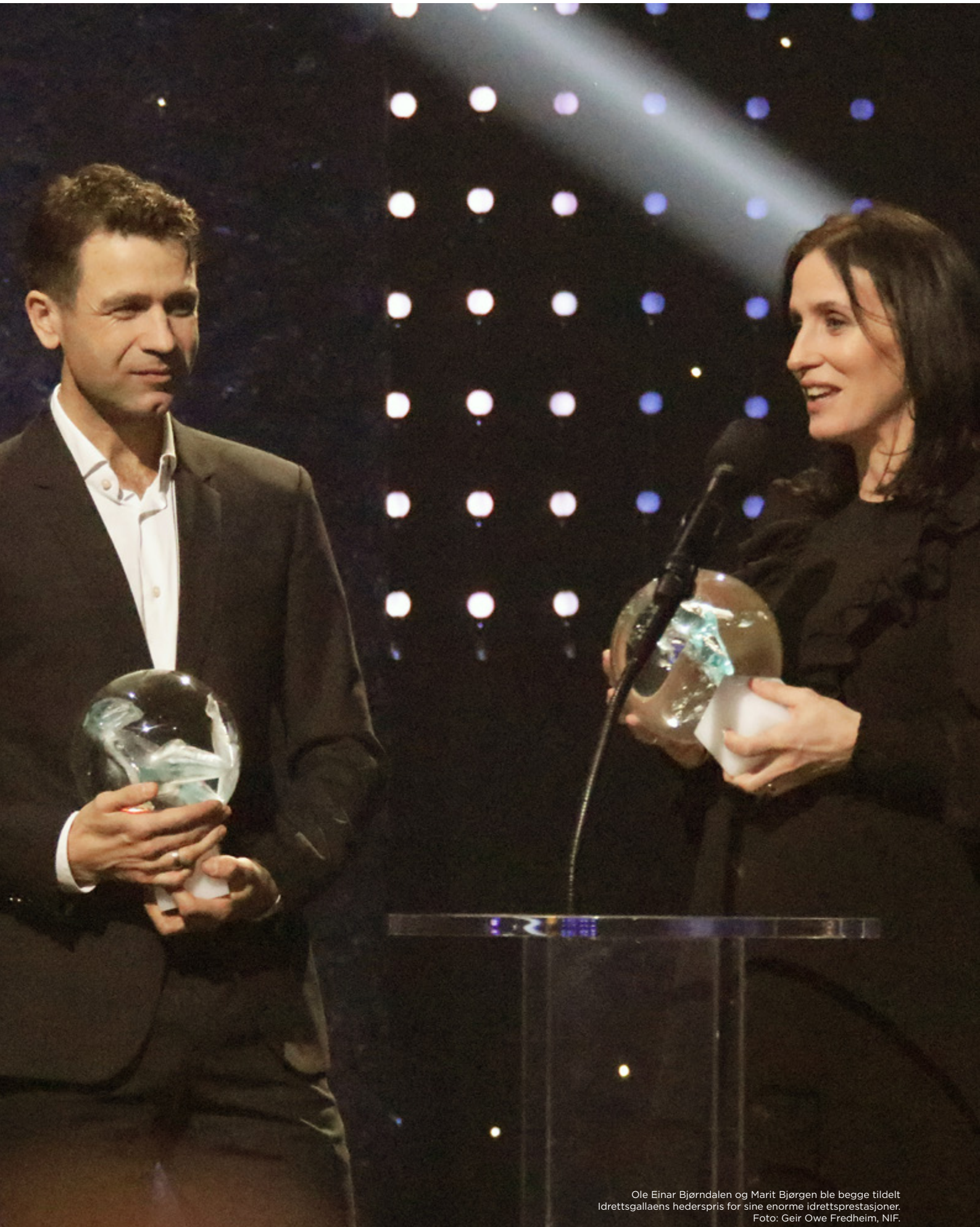
Ole Einar Bjørndalen og Marit Bjørgen ble begge tildelt Idrettsgallaens hederspris for sine enorme idrettsprestasjoner.