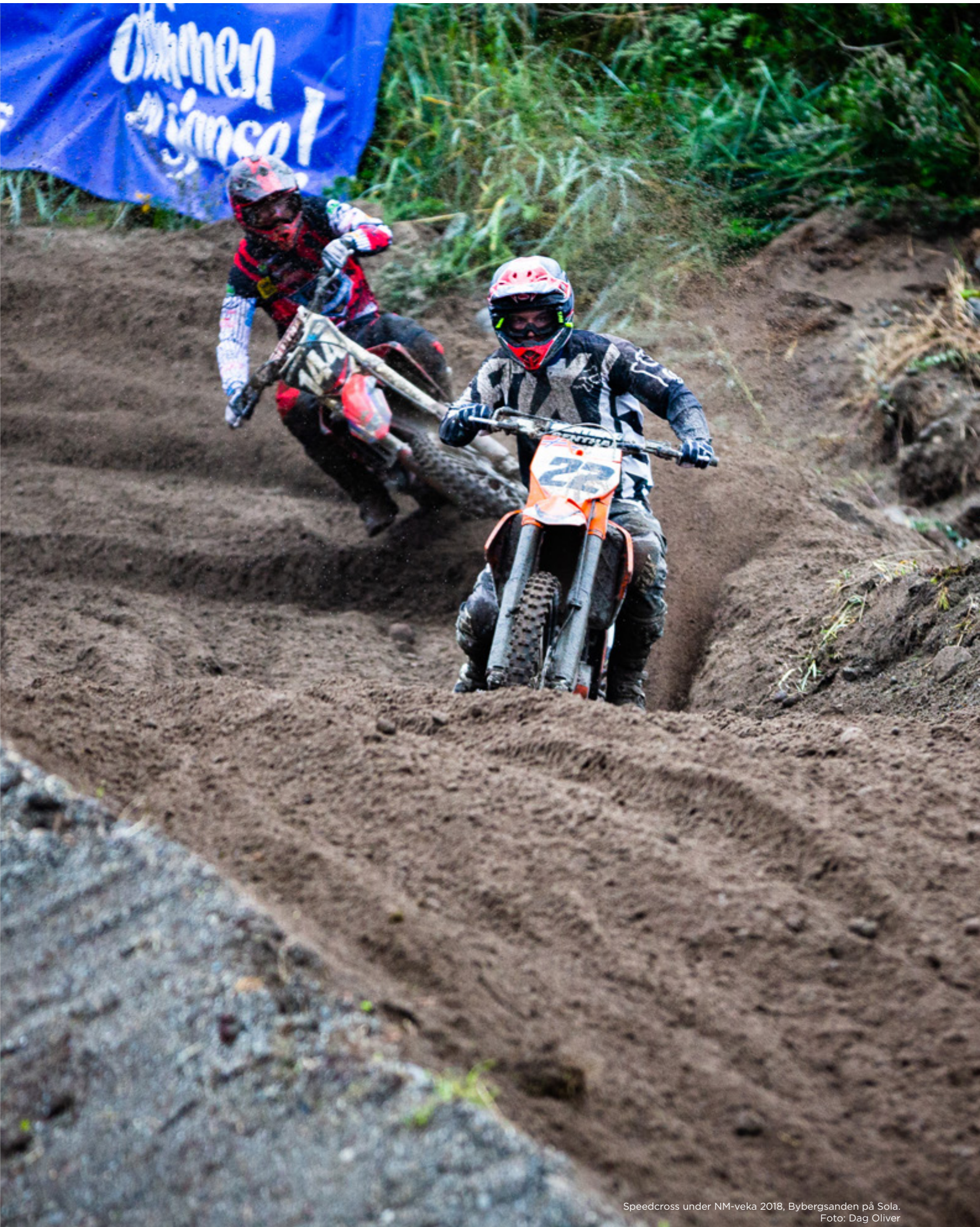
Speedcross under NM-veka 2018, Bybergsanden på Sola.