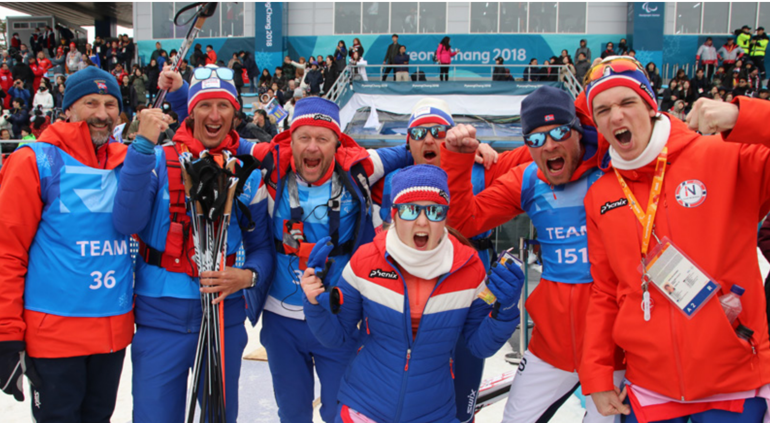
En glad gjeng under Paralympics i PyeongChang 2018.

Øvrebø tilfører at det også var flere andre vesentlige faktorer for Norges suksess.